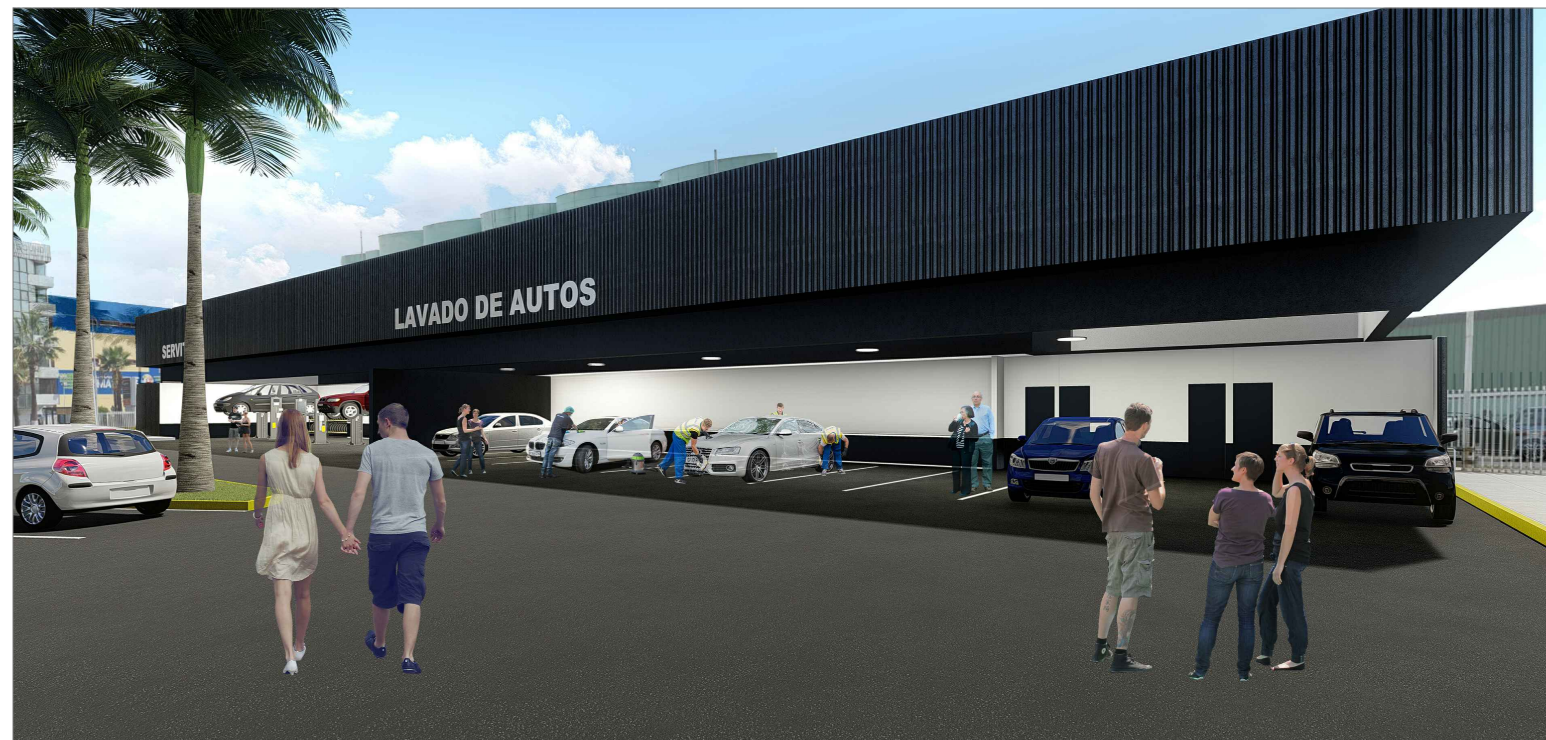
IMAGEN VIRTUAL LOCAL 02