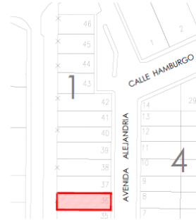
CROQUIS DE UBICACION